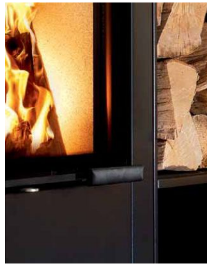
Piko L – RLA, Terra mit Holzfach als Anbauteil aus 8 mm massivem Stahl und Aschelade (Holzfach wahlweise auf der rechten oder linken Seite und in zwei Abmessungen möglich)